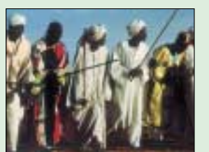
حلقات الذكر..... 7.6