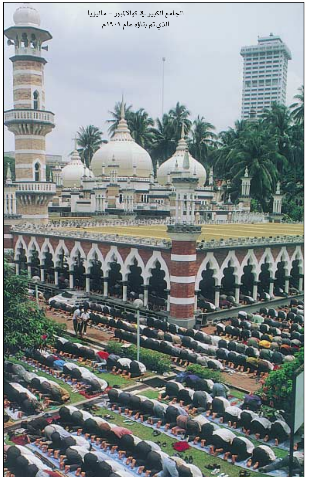
الجامع الكبير في كوالالمبور - ماليزيا الذي تم بناؤه عام ١٩٠٩ م