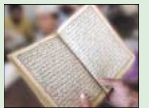
و ضرب لهم مثلاً..... 4