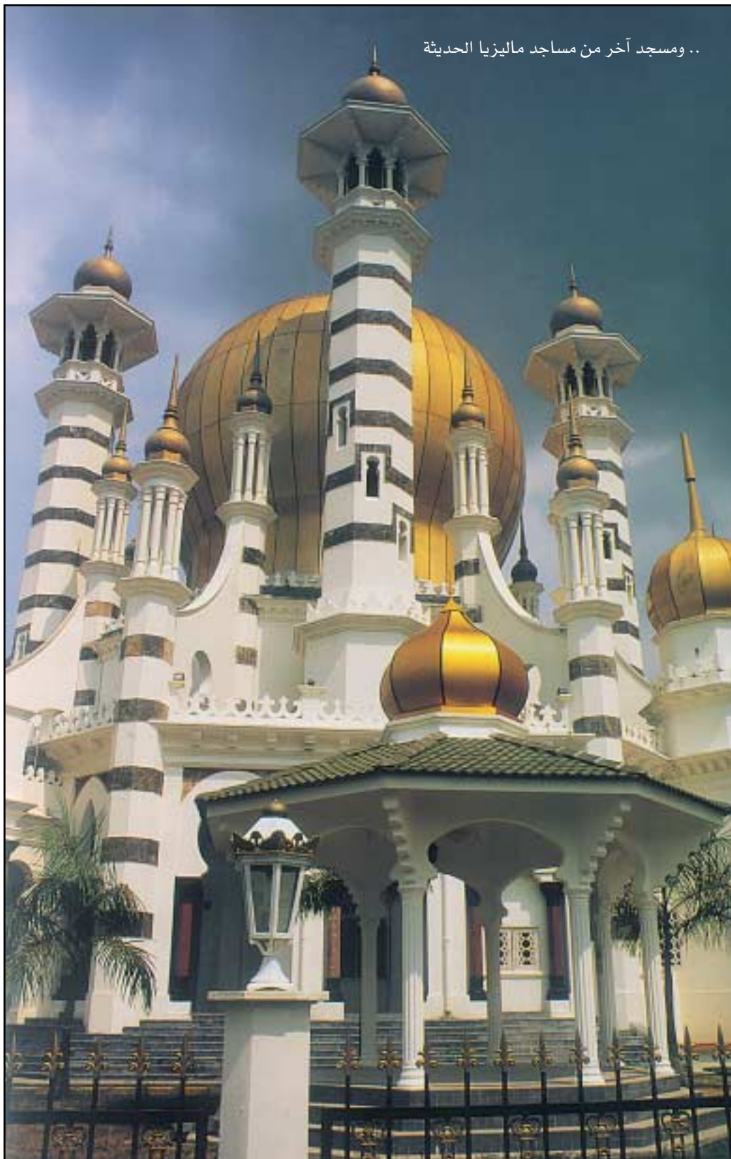
.. ومسجد آخر من مساجد ماليزيا الحديثة