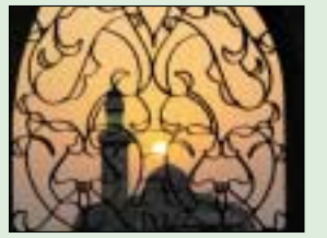
حقوق الجوار..... 9