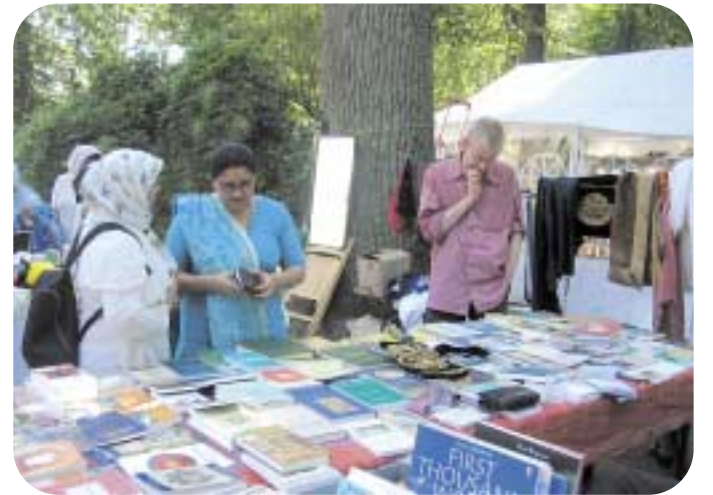
معرض بيع الكتب