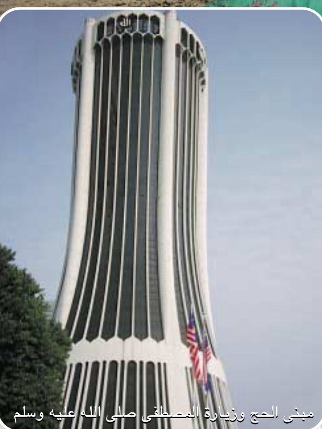
مبنى الحج وزيارة المحط على صلى الله عليه وسلم

وفي نهاية الزيارة قال لنا الأخ جوهرى هناك مقامات كثيرة أخرى في مدينة بينين ومدينة كلانتان منها مقام الحاج عبد الرحمن وغيره الكثير والكثير ونحن ننوي بناء زاوية برهانية بجوار مقام هارون الرشيد من أجل الحضرة والذكر