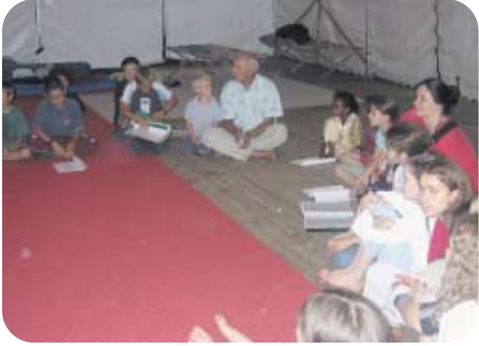
تدريب للأطفال على قراءة الأوراد