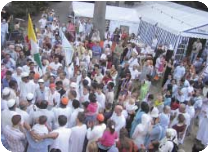
منظر من الزفة