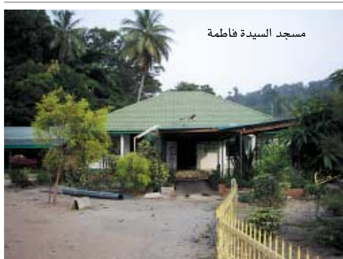
مسجد السيدة فاطمة

قبل خمسة قرون من عمر الزمان أتى العارف بالله سيدي علي بن عثمان الهجويري إلى لاهور وكانت تابعة لبلاد الهند والسند آنذاك وقد سماه أهل الهند (حضرت داتا كنج بخش) ويقولون أنه خال سيدي عبد القادر الجيلاني رضي الله عنه وقد نزل حضرته على قوم يعبدون الأصنام فقام ببناء خلوة بسيطة بدأ فيها صلواته وتلاوة القرآن وقراءة الأوراد ثم بدأ الناس يتوافدون عليه يلتمسون بركته لكراماته الظاهرة حيث نبعت عين من الماء الصافي بجوار خلوته ونبتت أشجار الفاكهة حولها. ثم بدأ الناس يدخلون الإسلام على يديه فصار يعلمهم الأوراد كالاستغفار والتهليل ويحفظهم بعض قصار