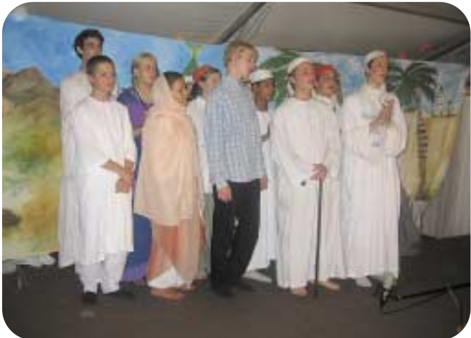
مجموعة من الأطفال ينشدون قصائد من ديوان شراب الوصل