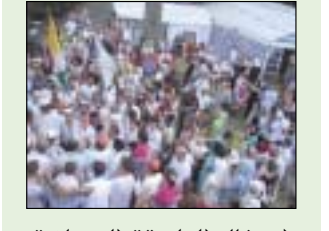
احتفال الطريقة البرهانية في ألمانيا.....12