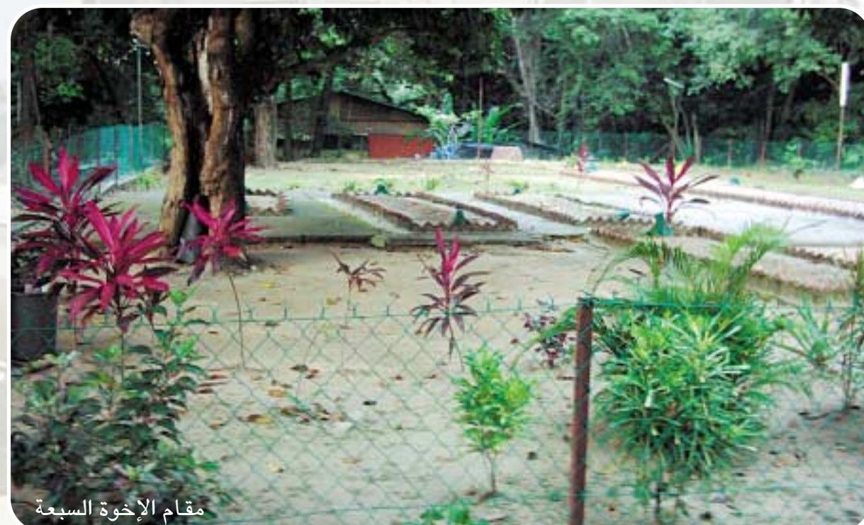
مقام الإخوة السبعة

وفي نهاية الزيارة قال لنا الأخ جوهرى هناك مقامات كثيرة أخرى في مدينة بينين ومدينة كلانتان منها مقام الحاج عبد الرحمن وغيره الكثير والكثير ونحن ننوي بناء زاوية برهانية بجوار مقام هارون الرشيد من أجل الحضرة والذكر