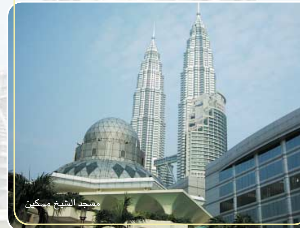
مسجد الشيخ مسكين

وفي أحد الأيام قام وفد رايات العز بزيارة أعلى الأبراج في العالم وكانت الزيارة من الباب الشرقي وقد وجدنا قرب الباب مسجدا فخما فسألنا الأخ محمد علي وهو ماليزي يقطن قرب المسجد هل في هذا المسجد ضريح لأحد الأولياء؟ فقال نعم ولكن هذا المسجد بني على إسم الشيخ مسكين وهو أحد خلفاء سيدي عبد القادر الجيلاني وله كرامات ظاهرة ولكن المقام ليس بداخل المسجد بل بعيدا عنه ونحن عموما نصلي هنا ولكن لانقطع من زيارة سيدي الشيخ مسكين رضي الله عنه فقد كان في حياته ملادا للحائر علم الناس القرآن وأطعم الجوعان ولم ينقطع الذكر من (السوراء) - وهي الزاوية أو التكية