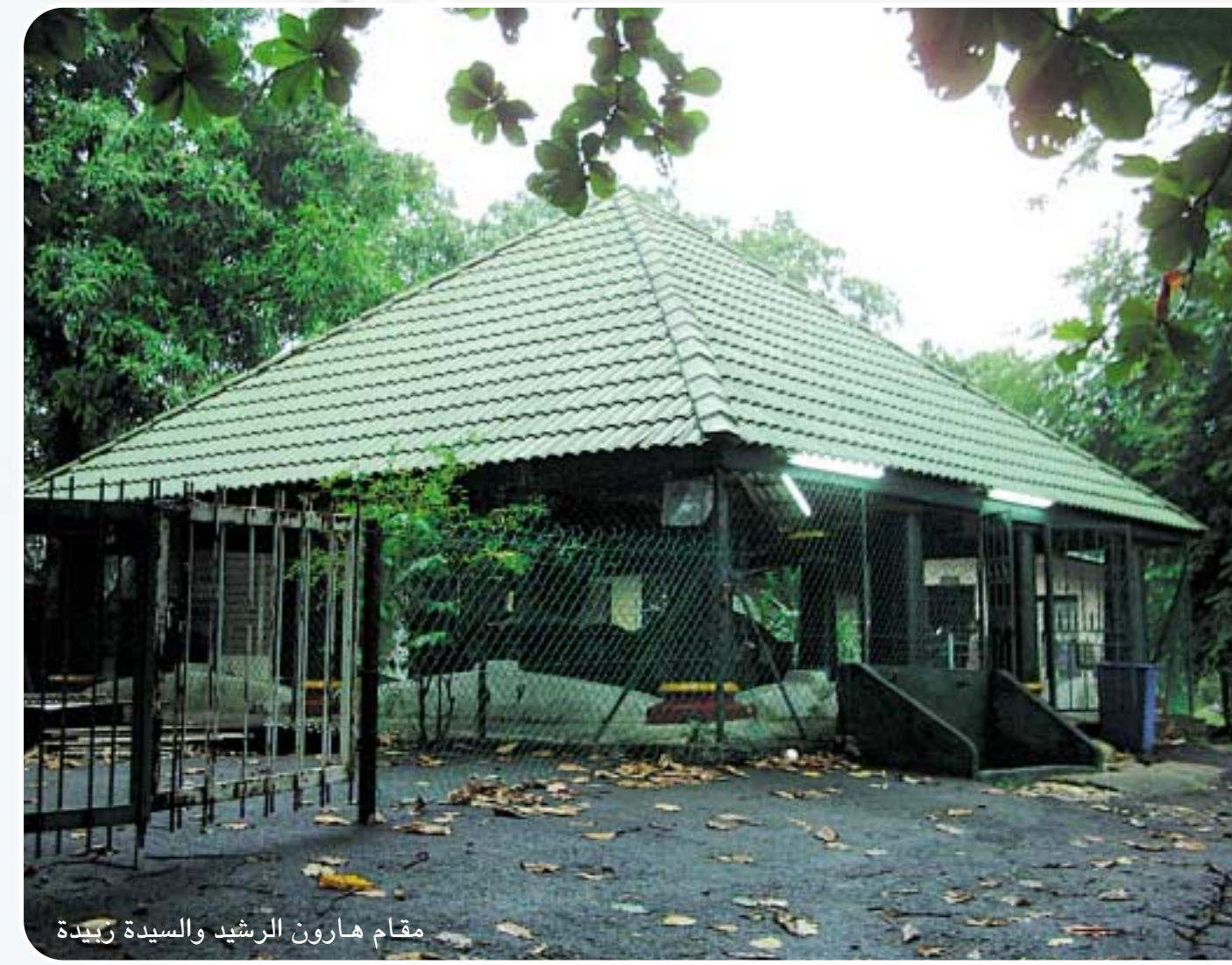
مقام هارون الرشيد والسيدة ربيدة