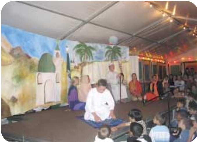
لقطة أخرى من مسرحية الأطفال عن حياة مولانا الشيخ محمد عثمان