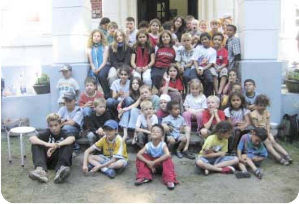
لقطة لمجموعة من الأطفال في احتفال هذه السنة