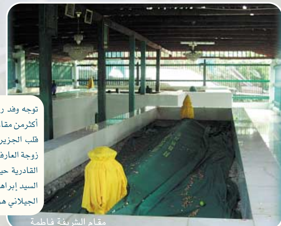
مقام الشريفة فاطمة

خليفة المقام الذي أكد رواية جدته عن صاحب المقام وقال أنه سمع من أبيه وسمع أبيه من جده وهكذا وقال نحن نحتفل في ١٦ أغسطس من كل عام بمولد هارون الرشيد والسيدة زبيدة ويأتي أحباب الأولياء من كل ماليزيا وسنغافورة والهند لهذا الإحتفال لمدة أسبوع كامل حيث تقام حضرات الذكر وقصائد المديح باللغة العربية والأوردية والماليزية وتمد موائد الطعام لكل من يؤم المقام الشريف،