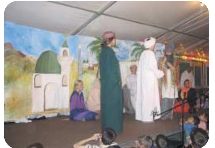
لقطة من مسرحية الأطفال عن حياة مولانا الشيخ محمد عثمان