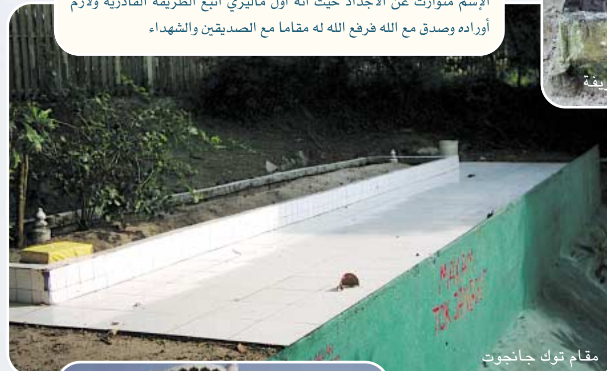
مقام توك جانجوت

وبعد ذلك توجهنا إلى مقام (توك جانجوت) ومعناها بالمليزية اللحيتين وهذا الإسم متوارث عن الأجداد حيث أنه أول ماليزي اتبع الطريقة القادرية ولازم أوراده وصدق مع الله فرغ الله له مقاما مع الصديقين والشهداء