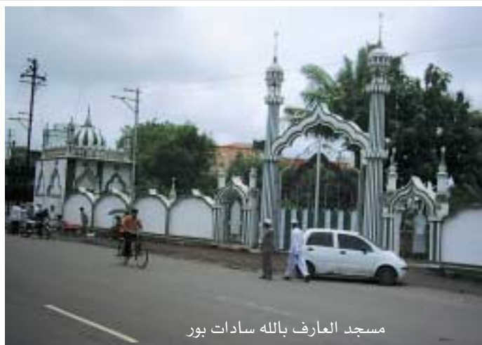
مسجد العارف بالله سادات بور

جنسه أو دينه، إلتف الناس حوله يأكلون ما يعده لهم بنفسه رضي الله عنه ويستقربون من أين يأتي هذا الطعام فهو يدخل الخلوة ويخرج بكل أصناف الطعام لهم، عرفوا أن هذا كله من بركات الشيخ الذي لا يتكلم إلا لضرورة ملحة ولا ينفك لسانه مشغول بتلاوة القرآن والذكر والصلاة على النبي صلى الله عليه وسلم.