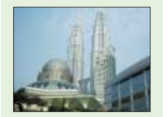
التصوف في ماليزيا.....6