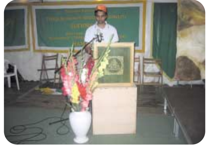
ثاقب من الدنمارك يتلو آيات من القرآن في افتتاح الحفل