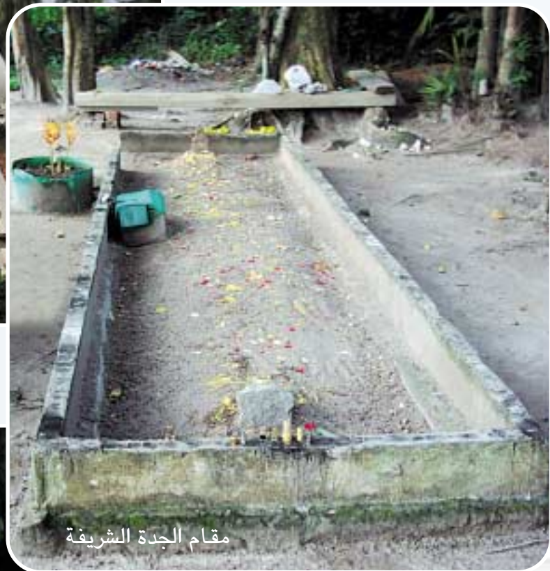
مقام الجدة الشريفة